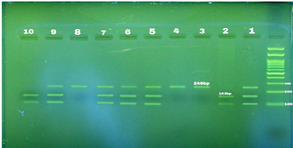
شکل ۱: نمونه‌ی تفکیک باندهای DNA در نمونه‌های سالم بر روی ژل الکتروفورز

مقایسه‌ی نحوه‌ی توزیع ژنوتیپ‌ها بین دو جنس مرد و زن به تفکیک گروه بیمار و سالم نیز در جدول ۳ نشان داده شده است. نتایج آزمون کای دو نشان داد که در گروه بیمار، بین دو جنس از نظر فراوانی توزیع ژنوتیپ‌های دافی اختلاف آماری معنی‌داری وجود ندارد ( P=۰/۵۸۸ ). از سوی دیگر نیز طبق نتایج آزمون