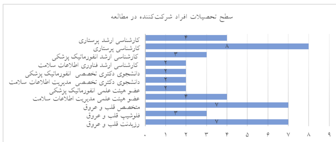
شکل ۲: نمودار سطح تحصیلات افراد شرکت‌کننده در این مطالعه به تفکیک تخصص و فراوانی

در مجموع ۴۴ نفر در این مطالعه شرکت کردند که ۴۷/۷٪ خانم بودند و میانگین سنی کل شرکت‌کنندگان تقریباً ۳۷ سال بود. و انفورماتیک پزشکی بودند. ۱۷ پزشک، ۱۲ پرستار و ۱۵ نفر از رشته‌های مدیریت اطلاعات سلامت