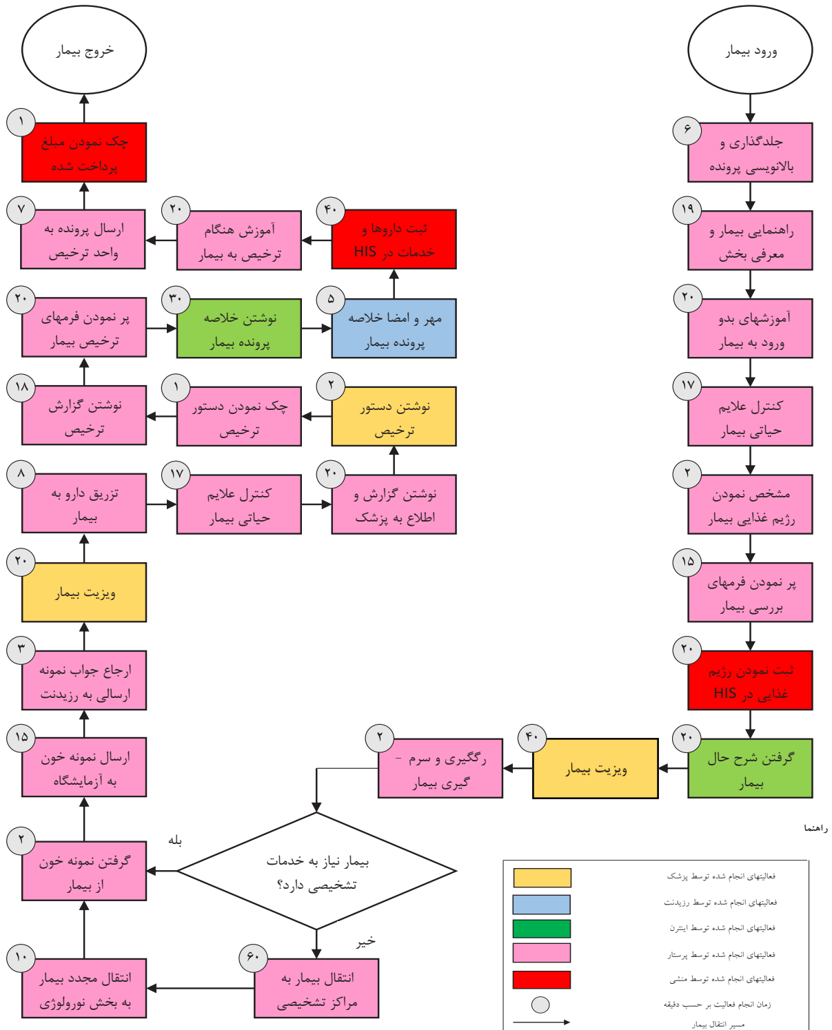
نمودار ۱: فرایند درمان بیماران نورولوژی اطفال