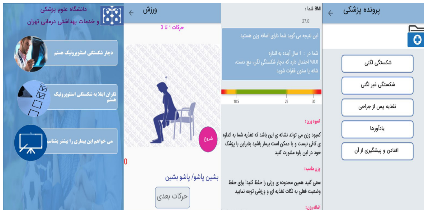
شکل ۲: تصاویر صفحات برنامه‌ی کاربردی مراقبت شکستگی‌های استئوپروتیک

جدول بالا و با استفاده از الگوریتم ارزیابی Qfracture آمده است که دارای اعتبار بالایی در ارزیابی شکستگی‌های استئوپروتیک و به‌خصوص شکستگی لگن می‌باشد. نتیجه‌ی این بخش، میزان خطر شکستگی استئوپروتیک در فرد و در بازه‌ی زمانی انتخاب شده توسط وی را نشان می‌دهد. مهم‌ترین بخش برنامه، برای بیمار مبتلا به شکستگی استئوپروتیک است. در این بخش، شکستگی لگنی و اطلاعات مربوط به آن، با توجه به اهمیتی که از دیدگاه متخصصان (جدول ۱) و نیز مطالعات مختلف داشته است، از سایر شکستگی‌ها منفک گردیده و در آن مواردی از جمله، تعریف شکستگی و اطلاعات لازم برای توان‌مندسازی و آگاه‌سازی بیمار از مراحل مختلف بیمارستانی، شامل پذیرش، نکات پیش از جراحی، جراحی و پس از آن، طول درمان و امکان تنظیم برنامه ورزش‌های توانبخشی لازم، آورده شد. سایر شکستگی‌ها در بخش شکستگی‌های غیرلگنی آمده است. در این بخش امکان تنظیم پرونده‌ی پزشکی و یادآور نیز وجود داشته و به‌همین دلیل، برخلاف دو بخش قبل، لازم است بیمار پیش از ورود، در ابتدا به منظور حفظ حریم شخصی خود ثبت‌نام نموده و نام‌کاربری و کلمه‌ی عبور تعیین نماید.