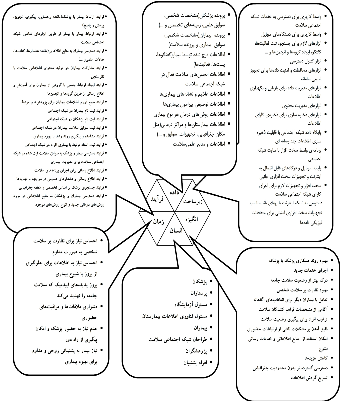
شکل ۱: مدل معماری مطلوب برای شبکه اجتماعی سلامت

از ۹ فرض بعد داده، همه تایید شدند. از ۱۷ فرض بعد فرایند، ۱ فرض رد و ۱۶ فرض تایید شدند. از ۱۴ فرض بعد زیرساخت، همگی تایید شدند. در اینجا ۶ بعد انگیزه (۱۲ زیر سیستم)، انسان (با ۸ زیر سیستم)، زمان (۶ زیر سیستم)، فرایند (۱۶ زیر سیستم)، داده (۹ زیر سیستم) و