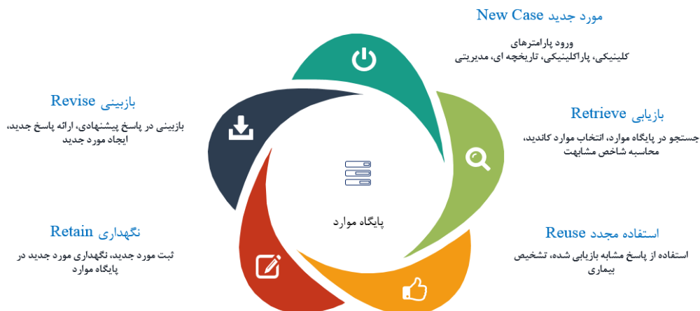
شکل ۲: معماری سیستم در مازول تشخیص افتراقی