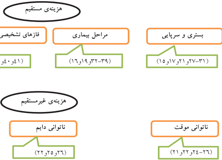
نمودار ۲: دسته‌بندی‌های مختلف هزینه‌های مستقیم و غیرمستقیم ارائه شده در مقالات مورد بررسی

بود. در ۴ مطالعه، تفکیک داده‌های هزینه براساس جنسیت نیز ارائه شده بود. مطالعات بررسی شده، گزارش‌هایی از هزینه‌های سرطان کولورکتال از اقصی نقاط جهان ارائه می‌دهد که بیشترین تعداد مطالعه مربوط به قاره آسیا با ۱۴ مطالعه، از کشورهای: چین (۴ مطالعه)، مالزی (۳ مطالعه)، ایران (۲ مطالعه) و کشورهای تایوان، اردن، تایلند، کره جنوبی و ویتنام هر کدام با یک مطالعه بررسی گردیده‌اند. ۹ مطالعه نیز به بار اقتصادی CRC در قاره اروپا پرداخته‌اند شامل کشورهای: ایرلند (۳ مطالعه)، آلمان (۲ مطالعه) و کشورهای صربستان، فنلاند، اسپانیا و بلژیک هر کدام