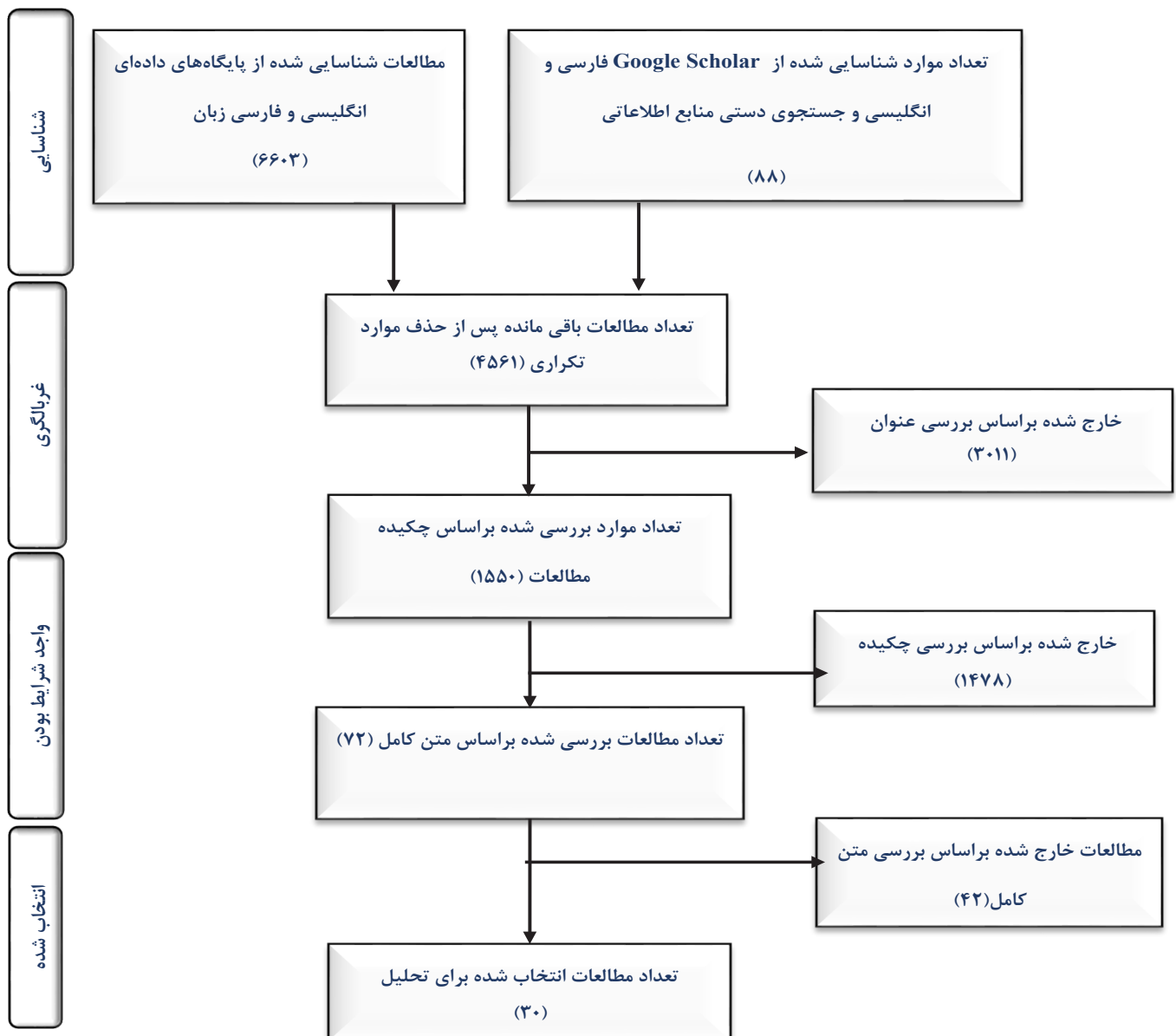
نمودار ۱: فرایند بررسی پایگاه‌های اطلاعاتی و غربالگری انجام شده

۶-ارایه راهنمایی‌ها و توصیه‌های عملی: براساس نتایج استخراج شده و نظرات اعضای تیم تحقیق، راهنمایی‌ها و توصیه‌هایی در قالب بحث، پیشنهادها و نتیجه‌گیری ارایه شد. این راهنمایی‌ها و توصیه‌های علمی به صورت نقد مطالعات انجام شده با رویکرد آینده‌پژوهی، پیشنهادها در زمینه‌ی استفاده از آینده‌پژوهی در حوزه سلامت بخصوص باروش سناریونویسی، انجام مطالعات بیشتر در این حوزه و ارایه مطالبی در جهت ارتقای بینش محققان، مدیران و سیاست‌گذاران سلامت بود.