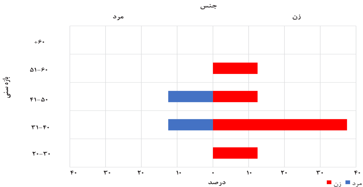
شکل ۱: نمودار توزیع اعضای پانل پژوهش بر حسب سن و جنس

از آنجاکه ابزار پژوهش پرسش‌نامه‌ی محقق‌ساخته بود، لازم بود تا ابتدا روایی و پایایی ابزار سنجیده شود. این امر از طریق توزیع بین