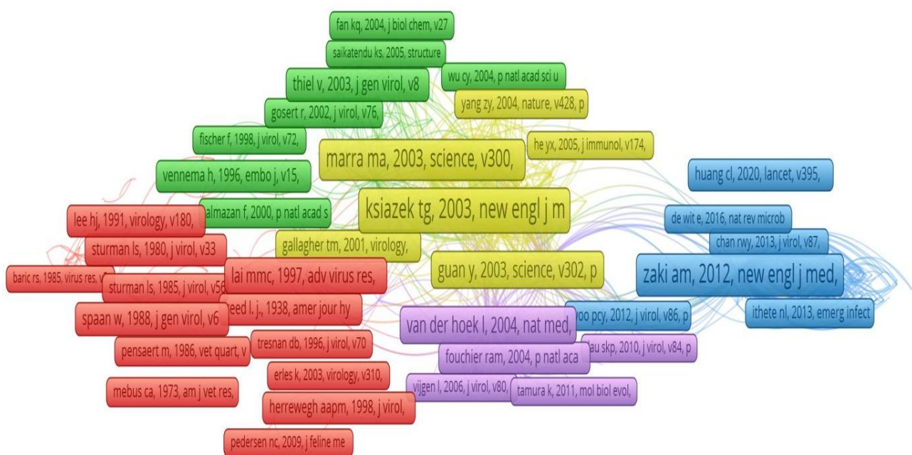
شکل ۲: شبکه‌ی هم‌استنادی مدارک برجسته‌ی حوزه‌ی کروناویروس دارای حداقل فراوانی ۵۰

در بازه‌ی زمانی ۲۰۱۹-۱۹۸۵ تعداد ۶۸۱۵ مدرک در حوزه‌ی کروناویروس انتشار یافته است، که از این بین Ksiazek (۲۰۰۳) با دریافت ۸۷۵ استناد، رتبه‌ی نخست، Drosten (۲۰۰۳) با دریافت ۸۶۶ استناد، رتبه‌ی دوم و Rota (۲۰۰۳) با دریافت ۸۳۷ استناد رتبه‌ی سوم را به‌دست آوردند. جهت ترسیم نقشه‌ی هم‌استنادی مدارک حوزه‌ی کروناویروس در