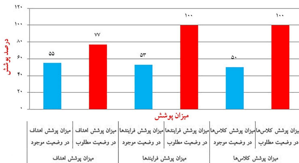
نمودار ۱: (ارزایی کارایی سیستم پیشنهادی نسبت به وضعیت موجود

زیرسیستم‌های غیرکارکردی در این لایه عبارتند از: امنیت، دسترس‌پذیری و اطلاعات پایه. لایه‌ی سوم لایه‌ی داده است. در لایه‌ی داده پایگاه اطلاعاتی جامع معاونت تحقیقات و فناوری دانشگاه قرار دارد که دربرگیرنده‌ی تمامی کلاس‌های داده‌های موجود در ماتریس CRUD می‌باشد. لایه‌ی آخر لایه زیرساخت است که شامل زیرساخت سخت‌افزاری، نرم‌افزاری و شبکه یکپارچه می‌باشد. همچنین سیستم اطلاعات مدیریت نیز در این سیستم پیشنهاد شده است. لازم به ذکر است که زیرسیستم آمار دو وجه دارد: یکی اطلاعات پایه که غیرکارکردی است