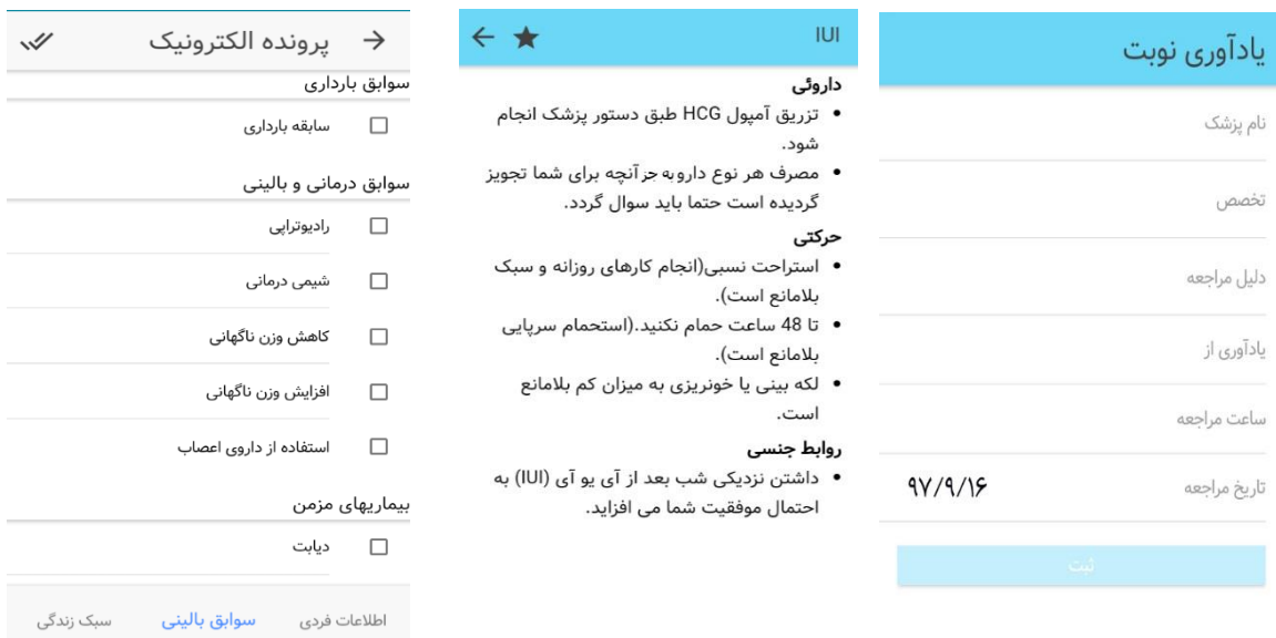
شکل ۳: صفحات پرونده‌ی الکترونیک، فودمراقبتی، یادآور

در شکل ۲ صفحه‌ی «روش‌های کمکی» دیده می‌شود که جهت آشنایی هر چه بیشتر زوجین با مراحل سیکل‌های درمانی روش‌های کمکی تولیدمثلی، آیتم جداگانه‌ای جهت معرفی سیکل‌های درمانی ایجاد شد. همچنین در این شکل بخشی از برنامه‌ی کاربردی قابل مشاهده است که به معرفی مراکز درمانی به تفکیک استان‌ها می‌پردازد، تا زوجین بر اساس