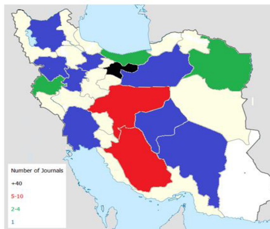
شکل ۲: پراکندگی مجلات نمایه شده حوزه‌ی پزشکی در سطح کشور

• پراکندگی مجلات نمایه شده‌ی حوزه‌ی پزشکی در سطح کشور در شکل ۲، پراکندگی مجلات نمایه شده در حوزه‌ی علوم پزشکی در سطح کشور قابل مشاهده است. یافته‌ها نشان داد که ۷۸ مجله مورد بررسی در ۱۵ شهر و ۱۴ استان کشورمان تهیه و منتشر می‌شوند.