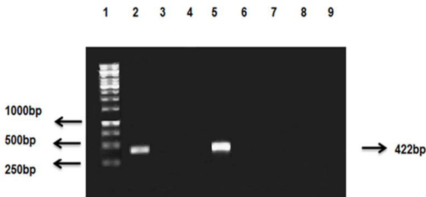
شکل ۱: PCR ژن eae

در این مطالعه از ۶۸ نمونه اسهال گرفته شده از کودکان زیر ۵ سال طغیان های کشوری، ۲۸ مورد (۴۱/۲٪) باکتری اشریشیاکلی با استفاده از تست های بیوشیمیایی جدا شد. با بررسی ژن eae، جدایه (۳/۶٪) اشریشیاکلی انتروپاتوژنیک شناسایی شد، که نتایج حاصل از PCR ژن eae در شکل ۱ نشان داده شده است. بر اساس واکنش سرولوژیکی آنتی ژن های سوماتیک (O) و فلاژلی (H)، سروتایپ اشریشیاکلی انتروپاتوژن جدا شده O119B14 بود. این جدایه EPEC از یک پسر ۳ ساله و مربوط به شهرستان سقز در استان کردستان بود، که دارای اسهال غیر خونی، تهوع، استفراغ، کرامپ شکمی بود و فاقد تب و سردرد و بی اشتهاپی و از آب آلوده استفاده کرده بود.