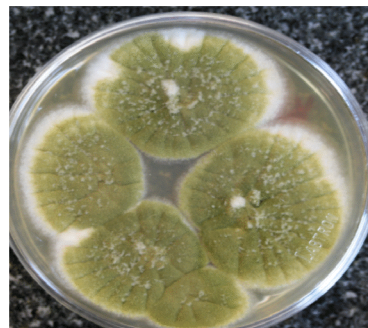
شکل ۲: کلنی‌های آسپرژیلوس فلاووس جدا شده از کشت نمونه‌های ناخن در قسمتهای تلقیح شده به میما