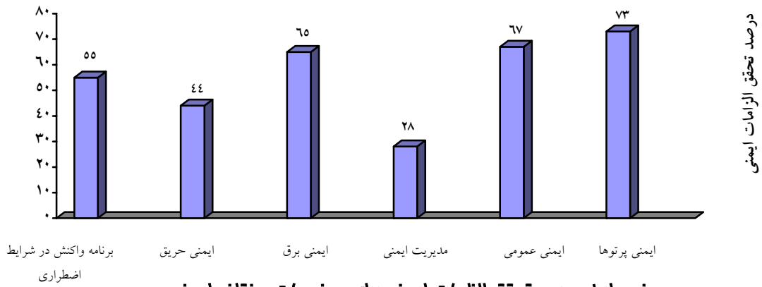
نمودار ۱: درصد تمقق الزامات ایمنی برای موضوعات مختلف ایمنی در مجموع بیمارستانهای مورد بررسی