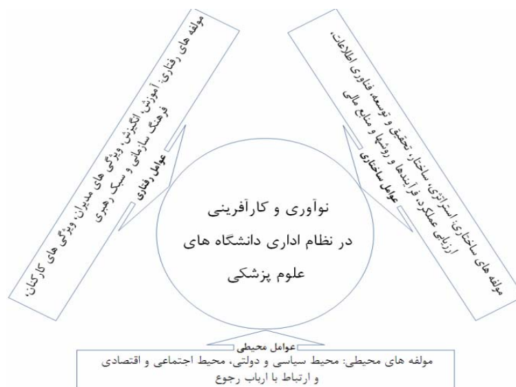
شکل ۲: الگوی مفهومی پژوهش

علت نام‌گذاری این مدل (سه شاخگی) این است که ارتباط بین عوامل ساختاری، رفتاری و زمینه‌ای به نحوی است که هیچ پدیده‌ای نمی‌تواند خارج از تعامل این سه شاخه انجام گیرد. در واقع، رابطه بین این سه شاخه یک رابطه تنگاتنگ ناگسستنی بوده و