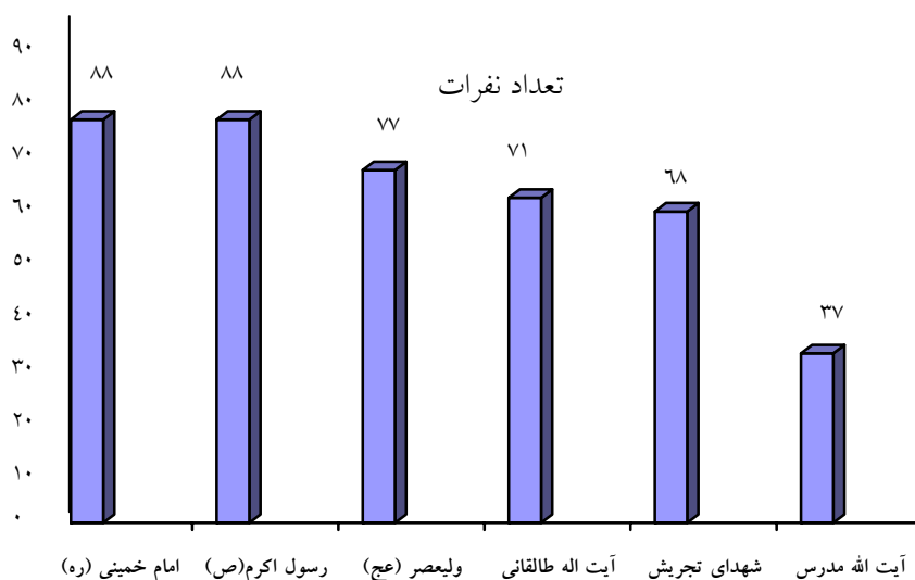
نمودار ۱: تعداد نمونه‌های آماری تمقیق در بیمارستان‌های مورد مطالعه