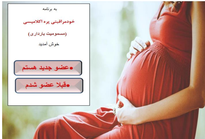
شکل ۲: صفحه ورود به برنامه کاربردی خودمراقبتی پره اکلامپسی مبتنی بر اندروید

گزارش‌گیری و اطلاع‌رسانی و زیر صفحات فرعی مرتبط با آن‌ها می‌باشد. همچنین در این صفحه از کاربر خواسته شده است تا با نظرات ارزنده‌ی خود از دو طریق ایمیل و پیام کوتاه پژوهشگران را در بهبود این برنامه یاری نماید.