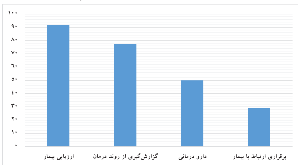
نمودار ۳: میانگین درصد موافقت متفصمان در محور عناصر اطلاعاتی تسهیل‌کننده روند درمان