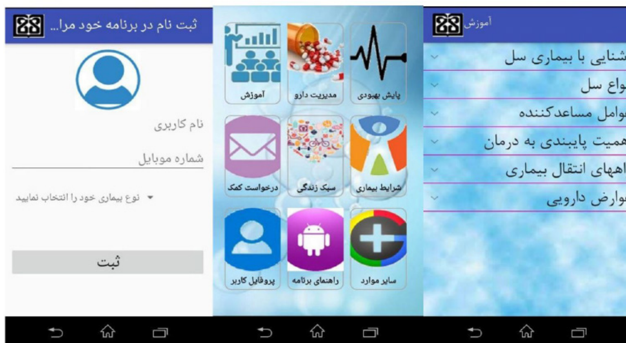
شکل ۲: نمایش بfnش های از اپلیکیشن TBMed

از آنجا که در مطالعه کنونی، هدف از ارزیابی، صرفا