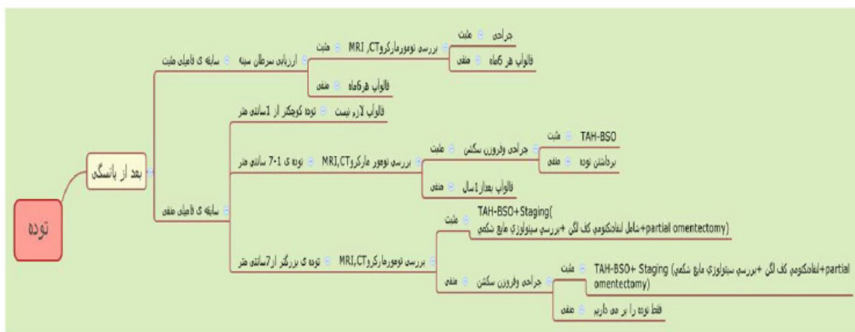
شکل ۱: نمای درختی مفاهیم پیمانه تشخیص سرطان اپیتلیال تخمدان بعد از یائسگی (TAH(Total Abdominal Hysterectomy))

در بخش دوم فاز توصیفی و در ادامه مرحله قبلی، مطالعه ای تطبیقی روی پرونده ها و فرمهای مراجعین به بیمارستان انجام شد. در این فاز پرونده ها به طور تصادفی از میان مراجعین به مرکز درمانی در سالهای مختلف انتخاب شدند و در نهایت ۹۳ پرونده ی با تشخیص به سرطان اپیتلیال مورد مطالعه قرار گرفت. بعد از بررسی محتوای پرونده ها، ۱۱ متغیر اصولی در سرطان تخمدان از پرونده ها استخراج شد و با تهیه چک لیست دیگری در اختیار متخصصانی که در مرحله ی قبل نیز در نظرسنجی شرکت کرده بودند، قرار گرفت و در نهایت تمامی متغیرها تایید شد. جدول ۲ این متغیرها را نشان می دهد.