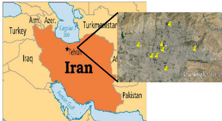
شکل ۲: مراکز رادیوتراپی مورد ارزیابی

EEC ضریب تعادل رادن با دخترانش است که برای محیط بسته ۰/۴ در نظر گرفته می شود و ۱۲ ضریب دز جذبی برای رادن است. occupancy factor برابر با میزان ضریب حضور فرد در سال