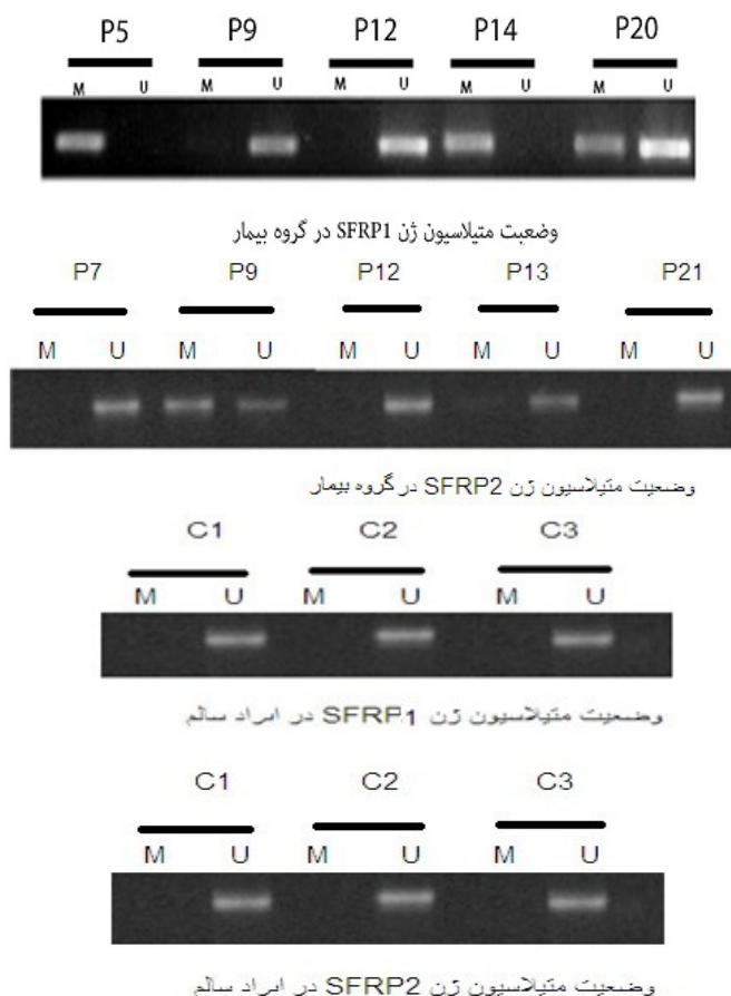
شکل ۱: وضعیت متیلاسیون پروموتور ژن های SFRP1 و SFRP2 در بیماران CML و نمونه های کنترل. تصاویر بالا نشان دهنده ی وضعیت متیلاسیون SFRP1 و SFRP2 در چند نمونه از بیماران مبتلا به CML و تصاویر پایین نشان دهنده ی نمونه های کنترل در افراد سالم. بیمار=P، متیله=M، غیر متیله=U

(۶۹/۶٪) مرد و ۱۰ نفر (۳۰/۳٪) زن بودند. محدوده سنی بیماران بین ۲۰ تا ۷۲ سال و میانگین سنی آنها ۵۸/۵ سال بود. شمارش گلبول های سفید و پلاکت ها به ترتیب در دامنه ۷۵۷۶۸/۷۸-۲۲۶۰۰۰ و ۳۴۶۰۰۰-۲۰۰۰ و میانگین آنها به ترتیب ۷۵۷۶۸/۷۸ و ۷۴۳۸۴/۸ سلول در میکرولیتر بود. طیف غلظت هموگلوبین در این بیماران ۱۲-۶/۵ گرم در صد و میانگین آن ۱۰/۹ گرم در صد بود. وضعیت متیلاسیون در بیماران به سه شکل غیر متیله، همی متیله و کاملاً متیله بود. برای ژن SFRP1 در افراد بیمار از ۳۳ بیمار ۸