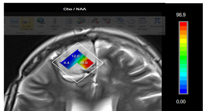
شکل (۱): الف- نقشه متابولیکی رنگی، ب- نمودار غلظت متابولیکی در خانم ۳۱ ساله

۱/۸۶۲ تا ۰/۰۶۶ از محدوده ی Cho از ۰/۴۸±۰/۳۸۹۹۳ و غلظت Cho/NAA با میانگین ۰/۱۸۴±۰/۶۳۰۹۴ تغییر کرده اند. افزایش میزان Cho/NAA از ۰/۶۶ تا ۷/۰۲۵۰ و با میانگین ۲±/۴۲۲ و افزایش میزان Cho/Cr از ۰/۵۴ تا ۳/۳۳ و با میانگین ۰/۶۲۷±۱/۶۸۶۰ در توده های مغزی مشاهده گردید. همچنین در مقایسه دو جامعه مستقل سالم با بیمار با \text{Sig} \leq 0/05 بود و تفاوت معنی دار بین دو جامعه، مشاهده شد. نتایج به دست آمده مشابه نتایج Alger JR و همکاران در ۱۹۹۰ می باشد. این افراد، موفقیت طیف سنجی هیدروژن (پروتون) را در تمایز تومورهای مغزی بدخیم از بافت طبیعی مغز در بزرگسالان و همچنین کودکان را تأیید کردند (۱۲). در مطالعه ای که در سال ۲۰۰۹ توسط Poussaint و همکاران انجام شد، آنها دریافتند که سیگنال Cho به جای شاخص تکثیر، به صورت خطی با تراکم سلولی در ارتباط است (برعکس آنچه که با ضریب نفوذ آشکار دیده می شود. بیک Cho اکثراً در مرکز