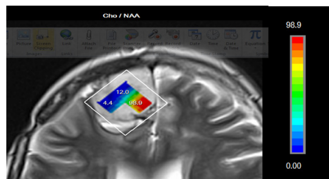
شکل (۱): الف- نقشه متابولیکی رنگی، ب- نمودار غلظت متابولیکی در خانم ۳۱ ساله

۱/۸۶۲ تا ۰/۰۶۶ از محدوده ی Cho از غلظت 0.48 \pm 0.38993 و با میانگین 0.184 \pm 0.63094 تغییر کرده اند. افزایش میزان Cho/NAA از ۰/۶۶ تا ۷/۰۲۵۰ و با میانگین 2 \pm 422 و افزایش میزان Cho/Cr از ۰/۵۴ تا ۳/۳۳ و با میانگین 0.627 \pm 1.6860 در توده های مغزی مشاهده گردید. همچنین در مقایسه دو جامعه مستقل سالم با بیمار با \text{Sig} \leq 0.05 بود و تفاوت معنی دار بین دو جامعه، مشاهده شد. نتایج به دست آمده مشابه نتایج Alger JR و همکاران در ۱۹۹۰ می باشد. این افراد، موفقیت طیف سنجی هیدروژن (پروتون) را در تمایز تومورهای مغزی بدخیم از بافت طبیعی مغز در بزرگسالان و همچنین کودکان را تأیید کردند (۱۲). در مطالعه ای که در سال ۲۰۰۹ توسط Poussaint و همکاران انجام شد، آنها دریافتند که سیگنال Cho به جای شاخص تکثیر، به صورت خطی با تراکم سلولی در ارتباط است (برعکس آنچه که با ضریب نفوذ آشکار دیده می شود. پیک Cho اکثراً در مرکز