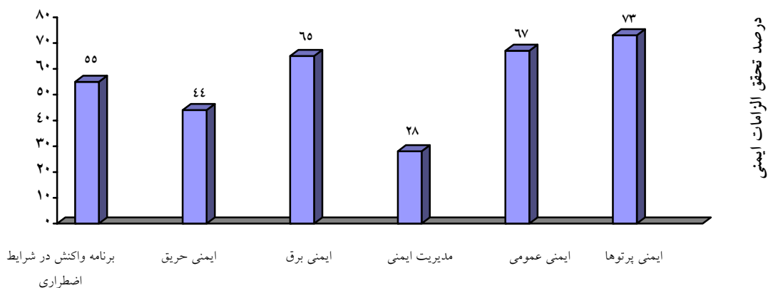
نمودار ۱: درصد تمقق الزامات ایمنی برای موضوعات مختلف ایمنی